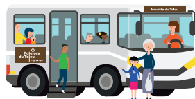
Navettes du Talou

Liste des arrêts sur le site www.falaisesdudalou.fr